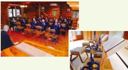
◎梅花流詠讃歌教室