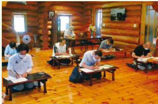
◎坐禅・写経の会 毎月第2・第4日曜日 午前9時