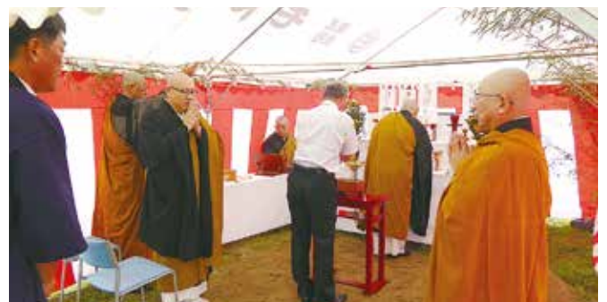
地鎮式 令和7年10月30日